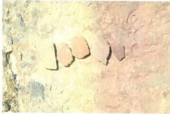
Mardin İli Savur İlçesi Serenli Yamaç Yerleşiminde bulunan seramik parçaları