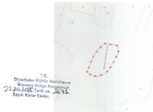
Serenli Yamaç Yerleşimi I.Derece öneri sit haritası