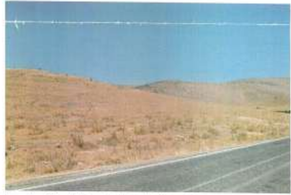
Mardin İli Savur İlçesi Serenli Yamaç Yerleşiminin Kuzey Görünüşü