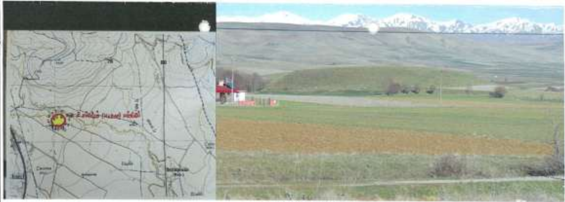
Diyarbakır Kültür Varlıkları Koruma Bölge Kurulunun 2340 sayılı Tarih ve 3/6/2015 Sayılı Kararı Esastir.