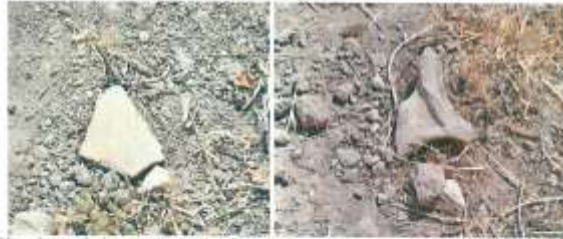
Höyük üzerinde yer alan seramik parçaları