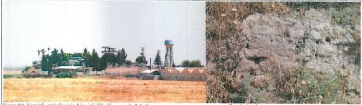
Nusaybin Nergizli mahallesinin Nergizli Höyük genel görünüşü