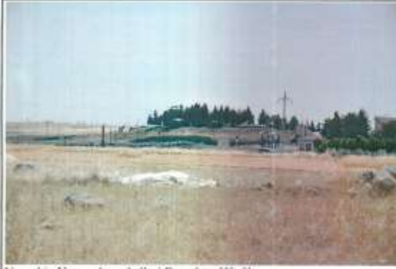
Nusaybin Yazyurdu mahallesi Bayraktar Höyük