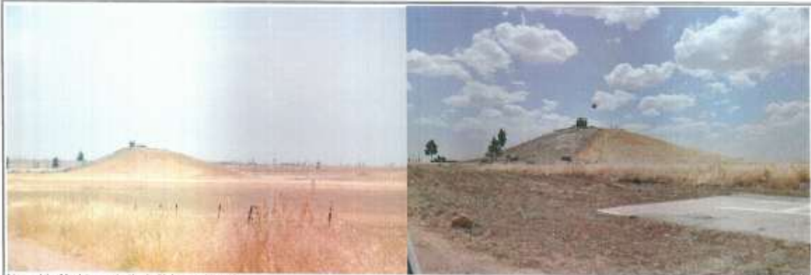
Nusaybin Yerköy mahallesi Şirintepe Höyük