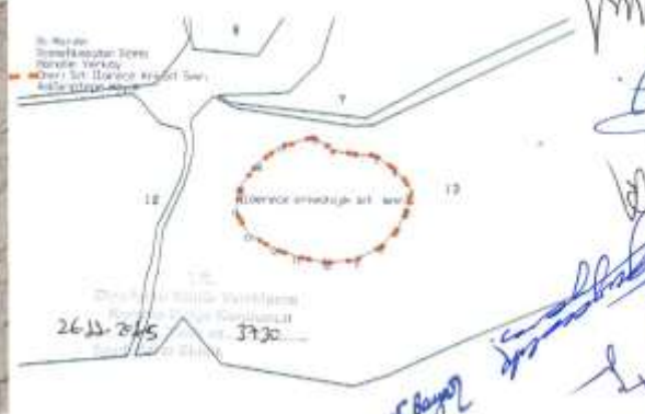
Şirintepe höyük sit haritası