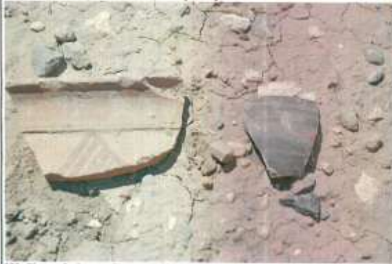
Höyük üzerinde yer alan seramikler