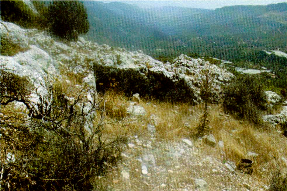
Resim 3: Çerçili Mahallesi, Karakoyak Mevkiinde yer alan mekân