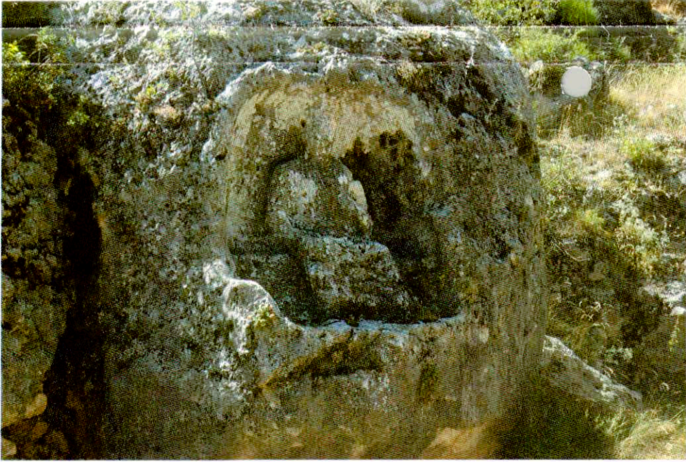
Resim 1: Çerçili Mahallesi, Karakoyak Mevkiinde yer alan Kaya kabartması