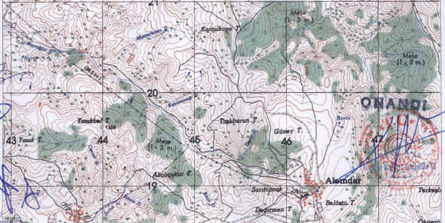
I. DERECE ARKEOLOJIKL SIT ALANI