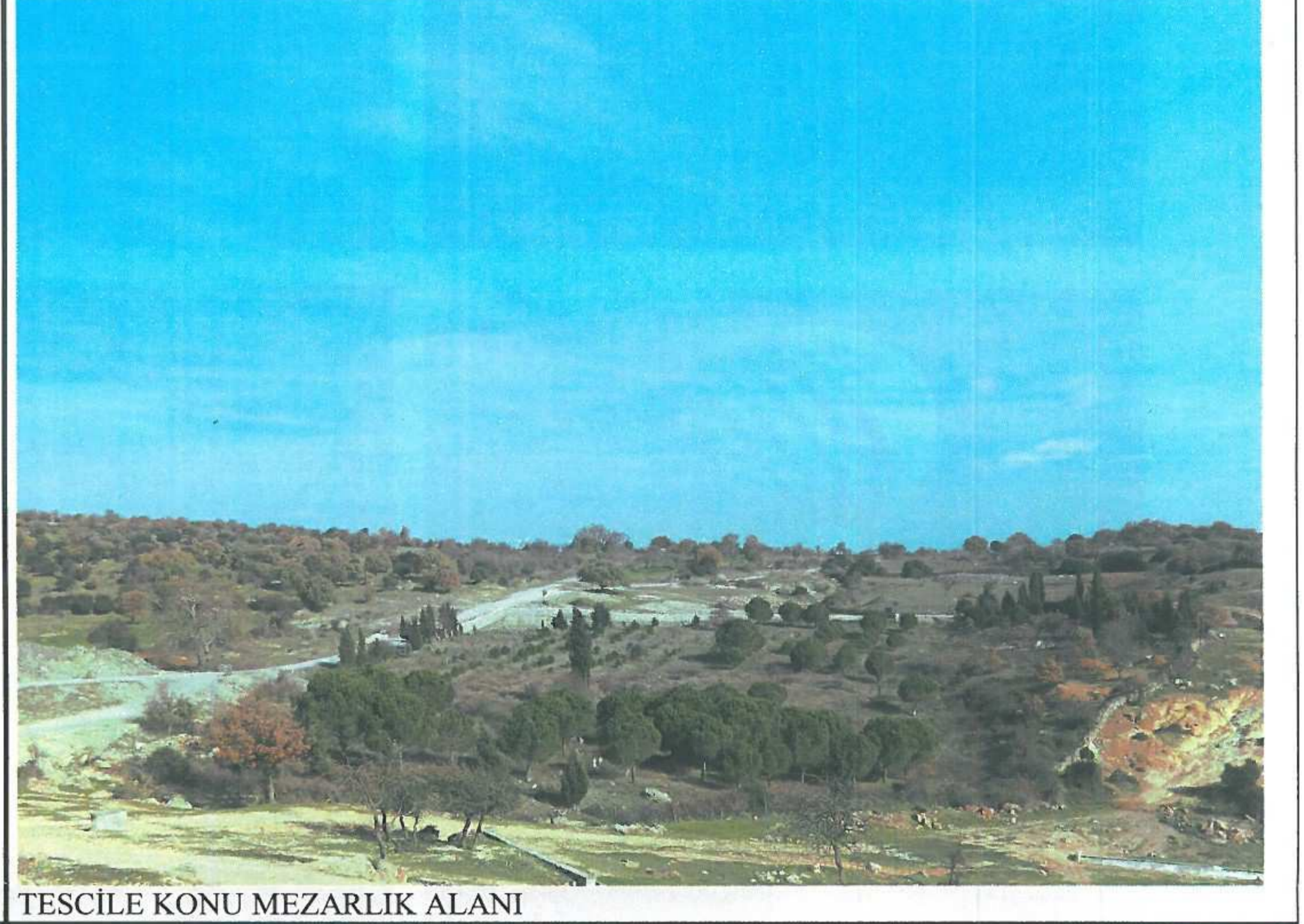
TESCİLE KONU MEZARLIK ALANI

GÖZLEMLER: Tescile konu parseldeki mezar taşları, mezarlık alanının etrafının güvenli bir koruma duvarı ile çevrili olmaması nedeniyle olumsuz dış etkilere açıktır. Mezarlık alanı eğimli bir arazi üzerinde yer alır. Mezar taşlarının geneli insitu şeklinde olmakla birlikte bir kısmı sökülüş vaziyettedir.