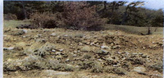
Kuzeydoğu nekropolünden kaçak kazılarla tahrip olan mezarlardan görünüm (res; 5,6).

T.C KÜLTÜR VE TURİZM BAKANLIĞI Kütahya Kültür Varlıklarını Koruma Bölge Kurulu Müdürlüğü