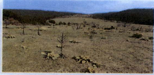
Kuzeydoğu nekropolünün genel görünümü (res; 1,2).