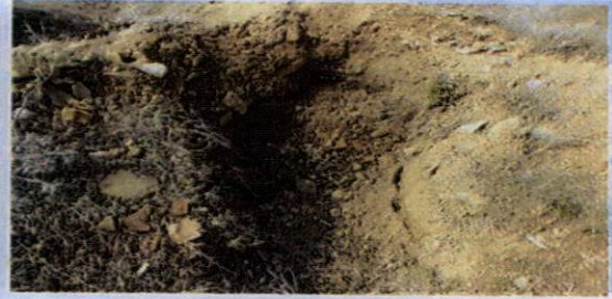
Kuzeydoğu nekropolünden seramik parçaları (res;3), kaçak kazı çukurlarından görünüm (res; 4).