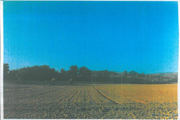
Kale Tepe Üzerinden Saros Körfezi