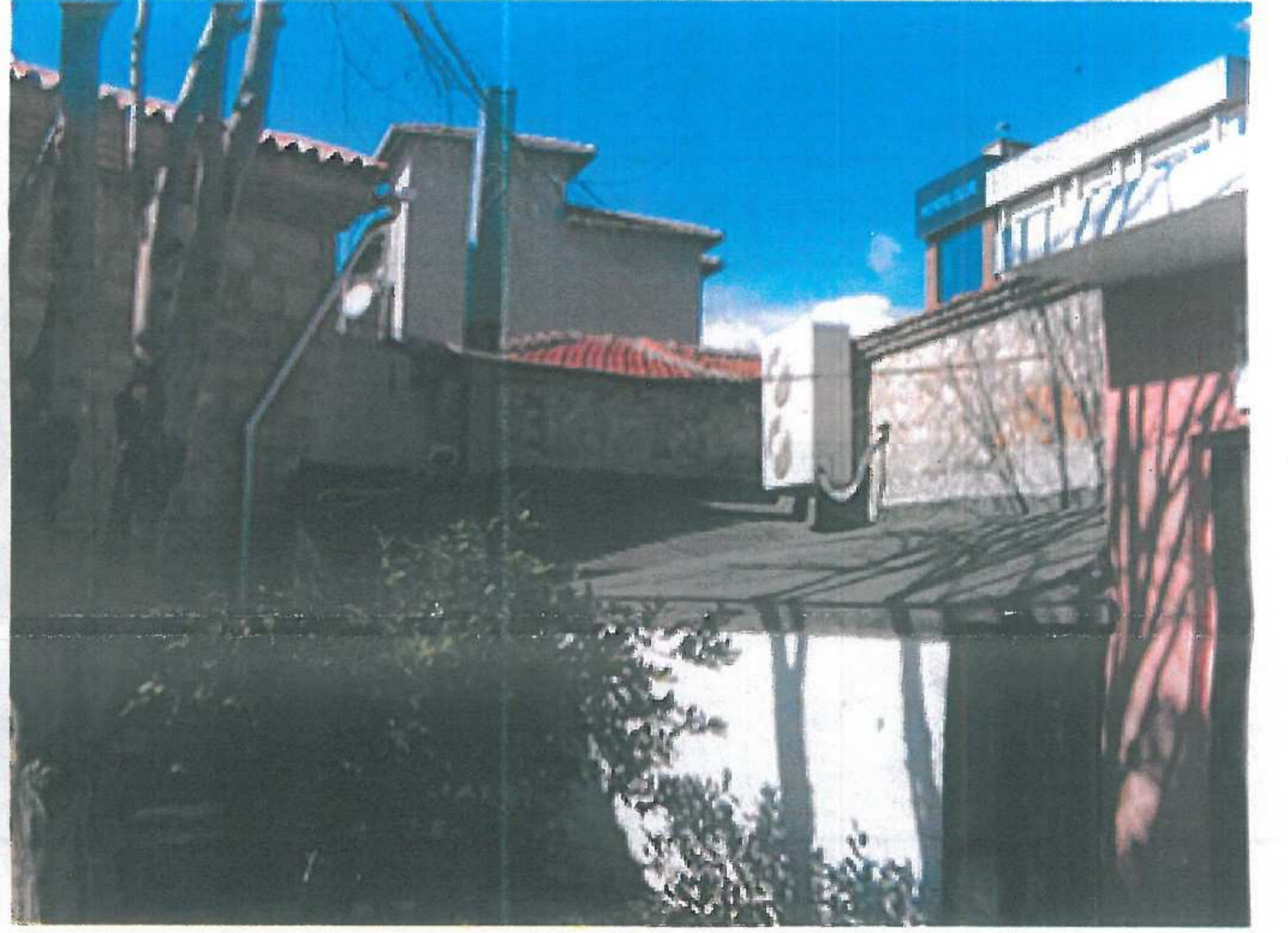
PARSELİN ARKA BÖLÜMÜ VE TESCİLLİ TIFLI CAMİİ İLE YAKINLIĞI