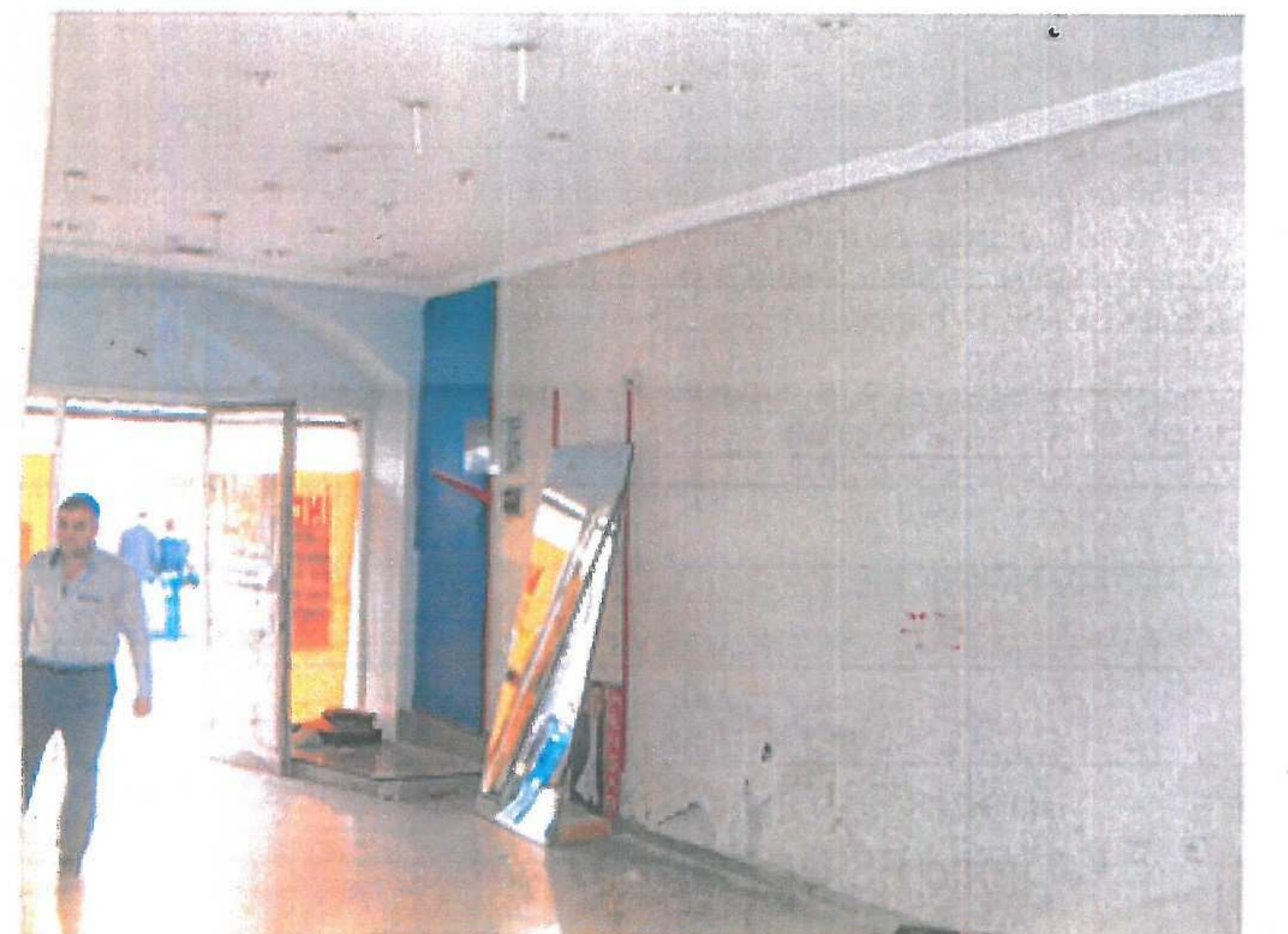
PARSELİN ORTA BÖLÜMÜNDEKİ BOŞ DÜKKANIN İÇ KISMI