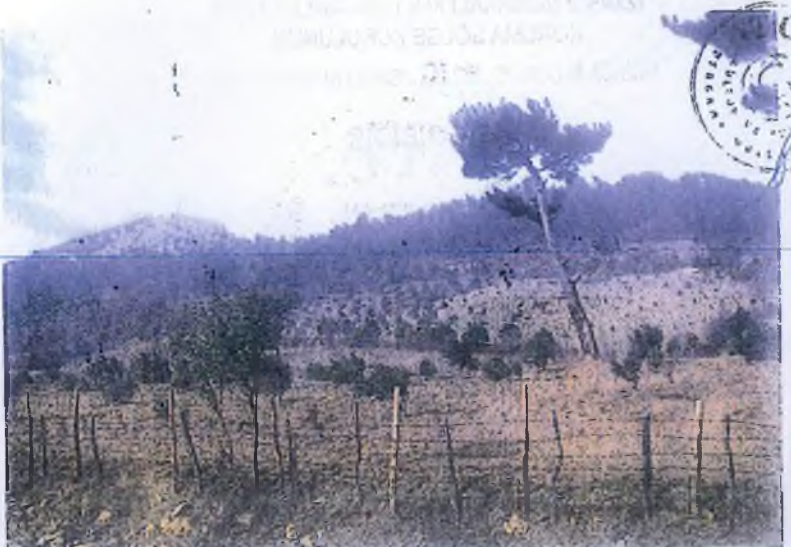
Foto 1. Çaltepe ve Dedetepe'nin Ürkütler köyüne giden yol üzerinden doğu yamaçlarının görünümü.