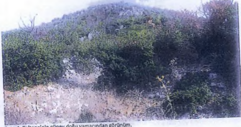
Foto 4. Çaltepe'nin güney doğu yamacından görünüm.