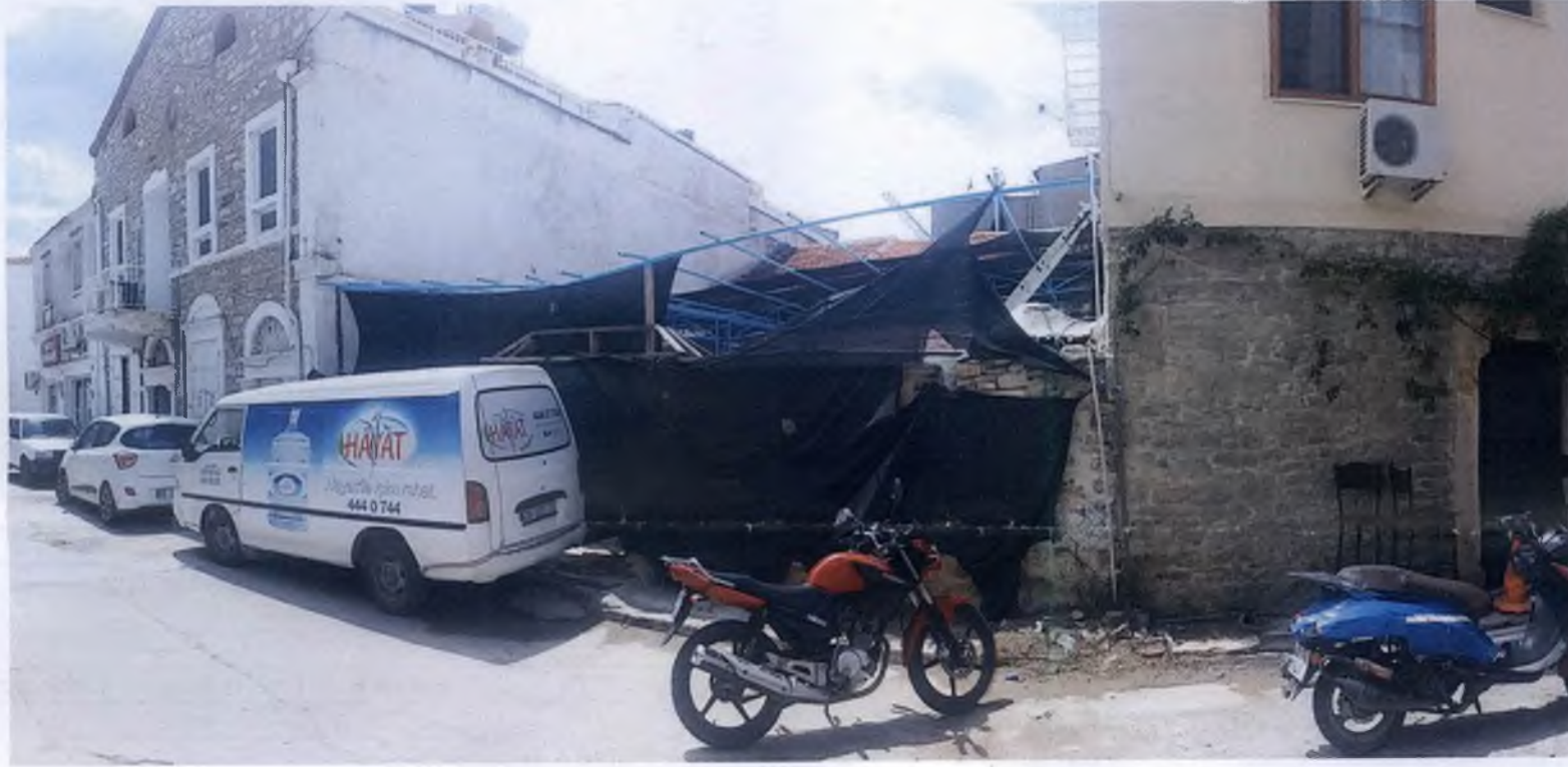
Arka yol cephesi görünümü