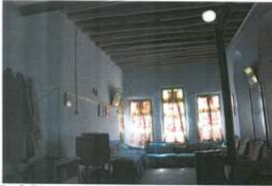
Foto 5: Evin üçüncü katında yer alan cumbass bulunan odadan görünüm.