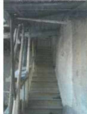
Foto 8: Evin üçüncü katına girişi sağlayan ahşap merdivenlerden görünüm.