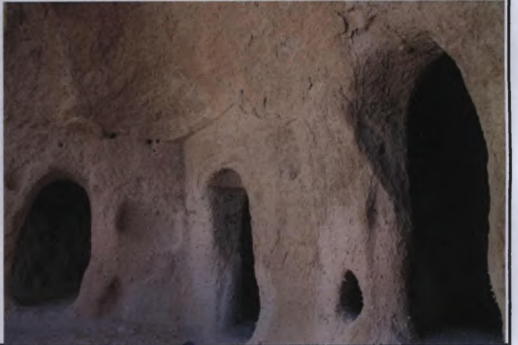
I. DERECE ARKEOLOJİK SİT ALANI

Handwritten signature in blue ink at the bottom right of the page.