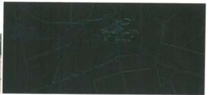
ÖNERİ SİT HARİTASI

T.C. Diyarbakır Kültür Varlıkları Koruma Bölge Kurulunun 29.12.2016 Tarih ve 442.5 Sayılı Kararı Ekidir.