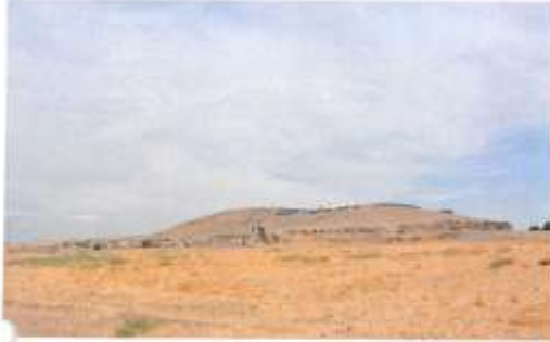
KIZILTEPE İLÇESİ BAŞAK KÖYÜ SİNERA HÖYÜK