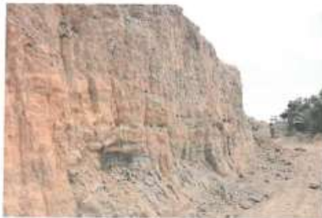
KIZILTEPE İLÇESİ BAŞAK KÖYÜ SİNERA HÖYÜK GÜNEY KESİTİ