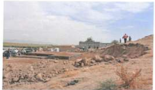
KIZILTEPE İLÇESİ BAŞAK KÖYÜ SİNERA HÖYÜK KAÇAK İNŞAAT