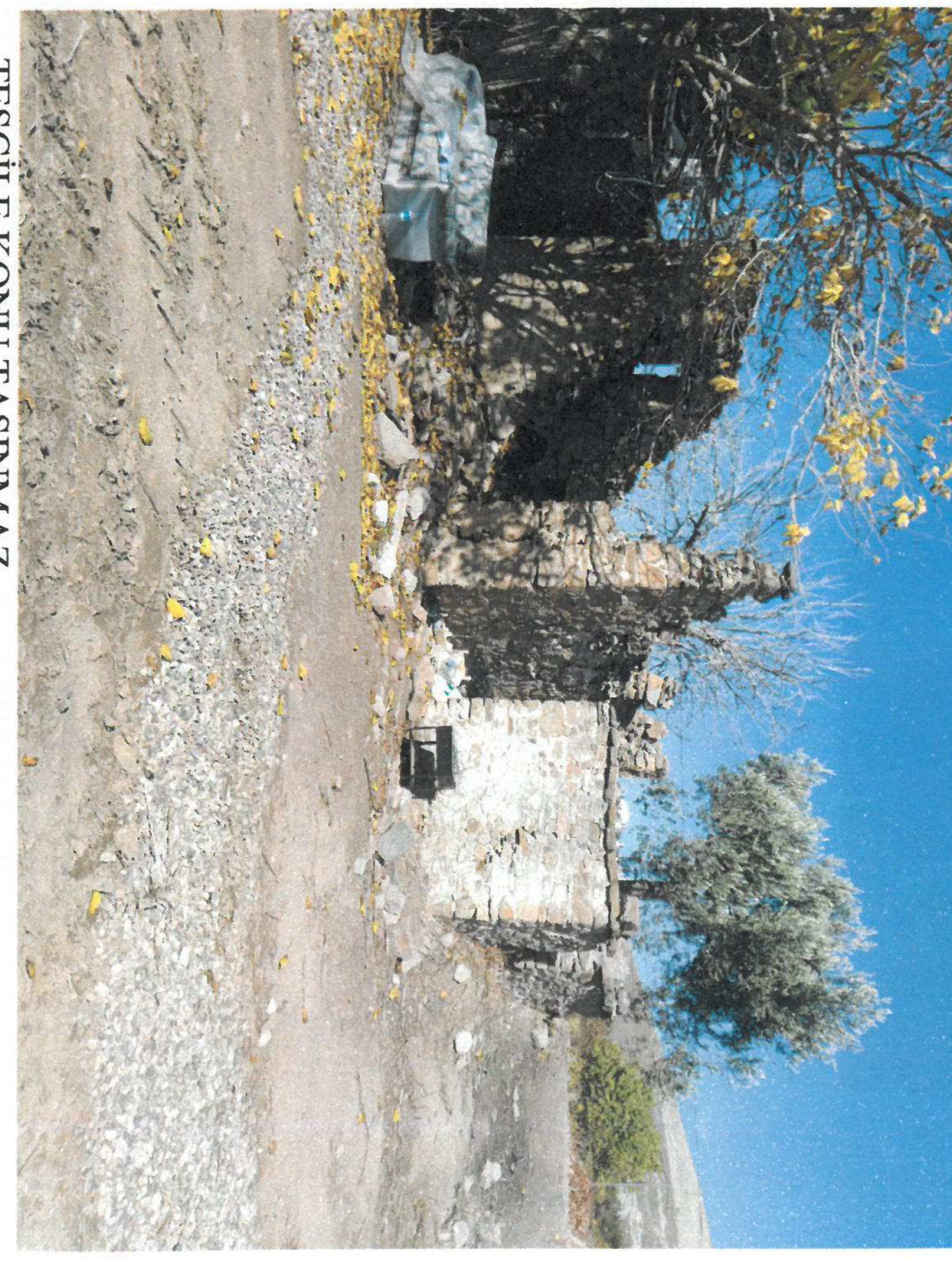
TESCİLE KONU TAŐINMAZ

GÖZLEMLER: Tescile konu binanın beden duvarları kısmen ayakta olup, yapının üst örtüsü çökmüş durumdadır.