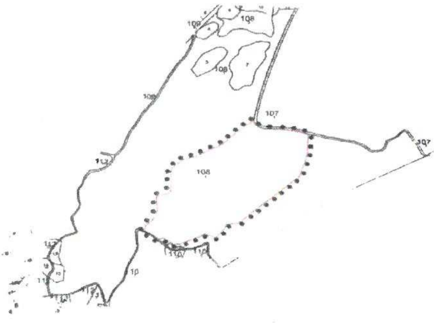
ÇANAKKALE İLİ, LAPSEKİ İLÇESİ, ÜÇPINAR KÖYÜ 1. DERECE ARKEOLOJİK SİT ALANI HARİTASI

GÖSTERİM ● 1. DERECE ARKEOLOJİK SİT ALANI OLÇEK: 1/10000