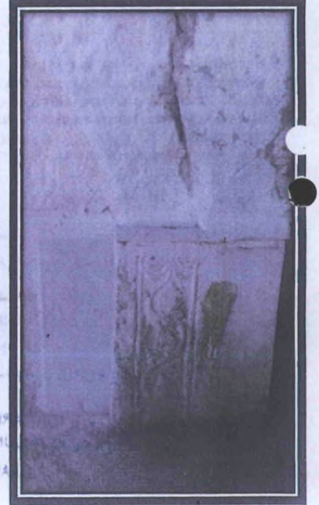
Çeşme Ayna Kısmı Detayları