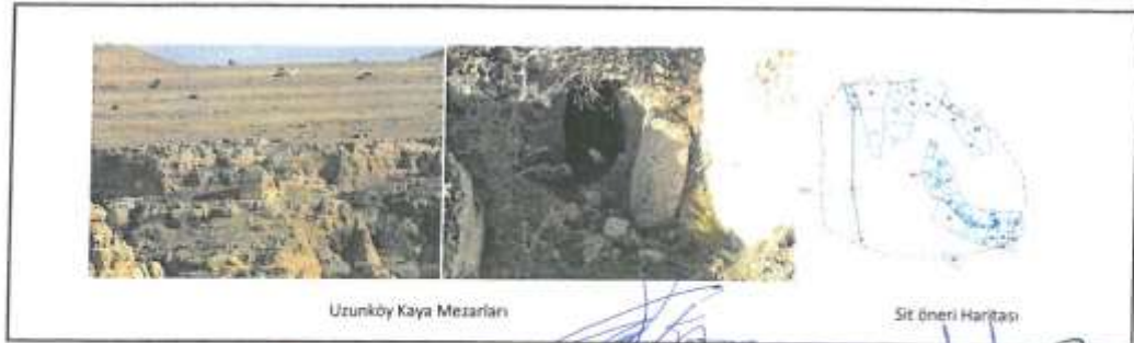
Uzunköy Kaya Mezarları