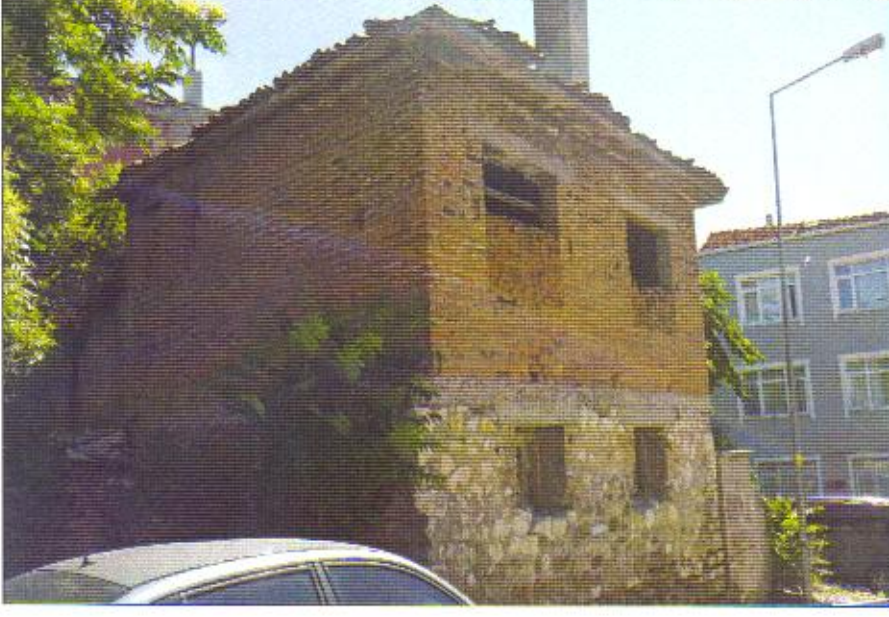
SİLVİRİ İLÇESİ, SELİMPAŞA MAHALLESİ 6182 PARSELDEKİ YAPIDAN GÖRÜNÜM.