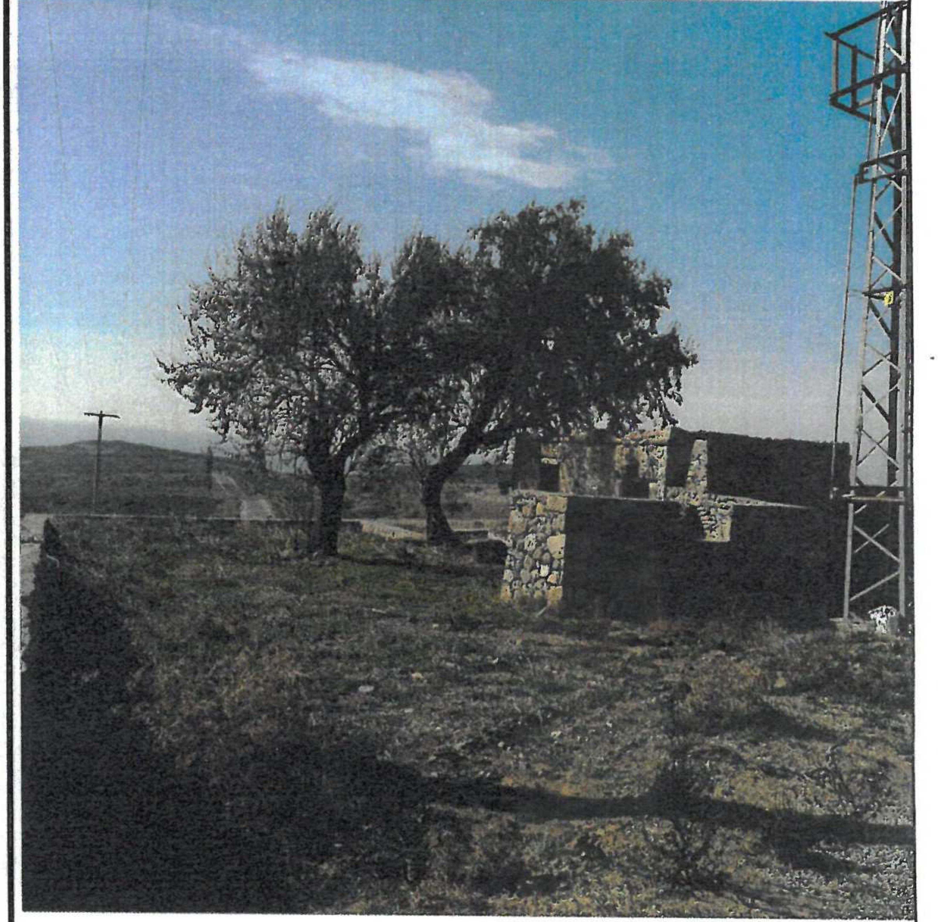
TESCİLE KONU TAŞINMAZ

GÖZLEMLER: Tescile konu yapının beden duvarlarının kısmen ayakta olduğu ancak üst örtü ve yapının iç bölümlerinin çöktüğü görülmüştür.