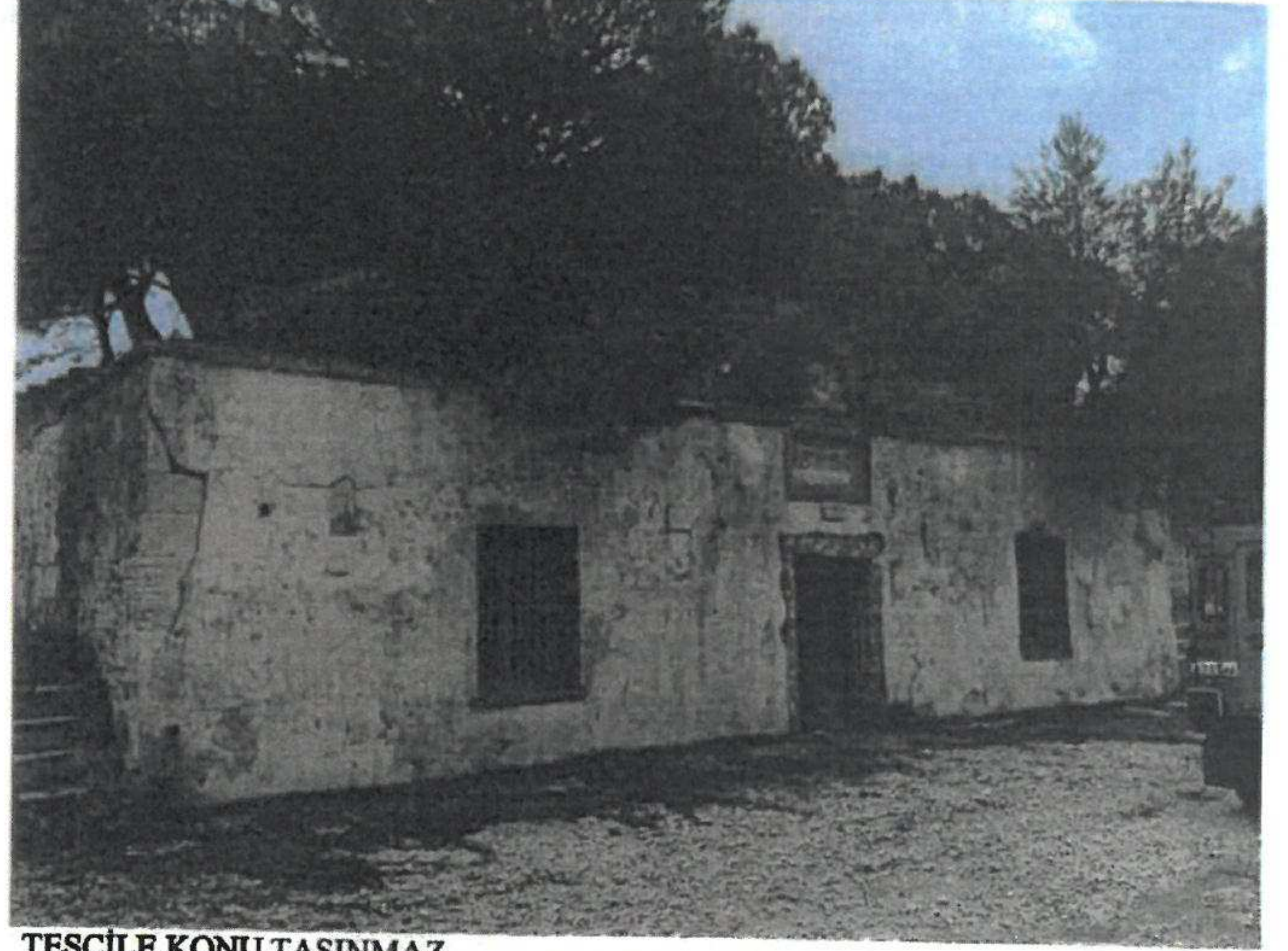
TESCİLE KONU TAŞINMAZ

GÖZLEMLER: Günümüzde atıl durumda bulunan tabya insan ve doğa tahribine karşı savunmasız durumdadır.