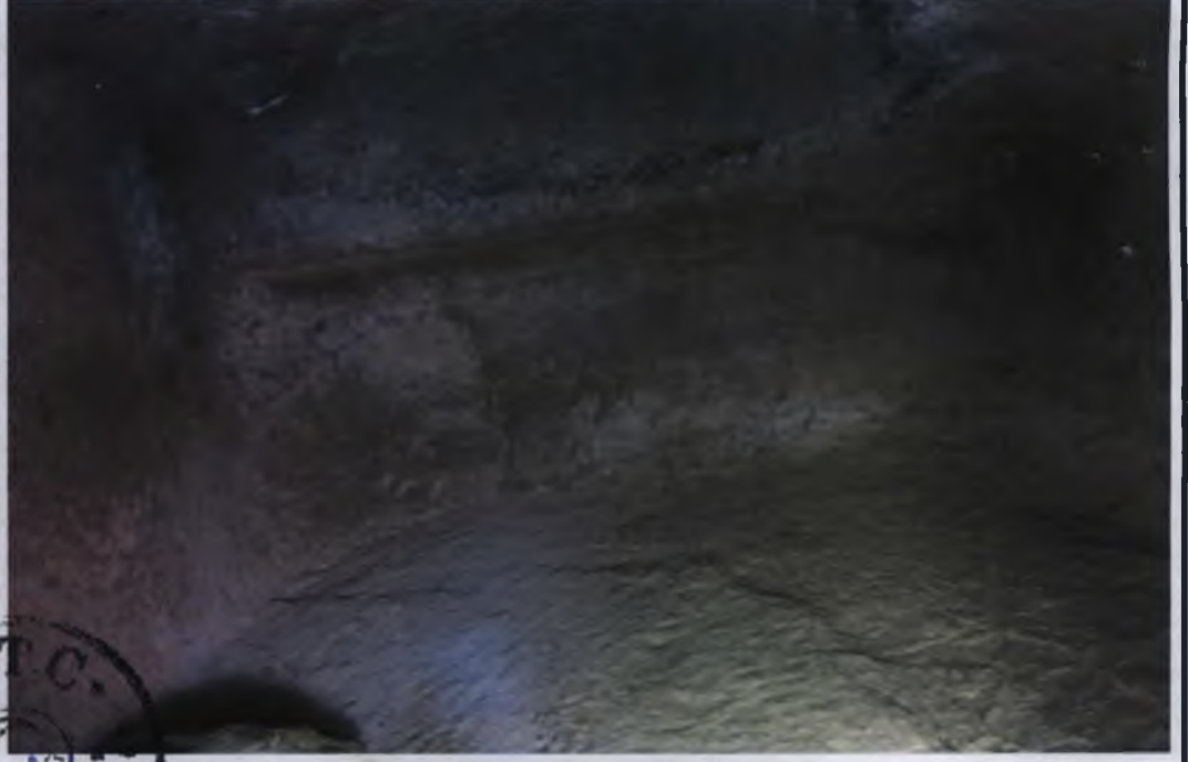
1 Nolu Kaya Oyma Mezar İçi