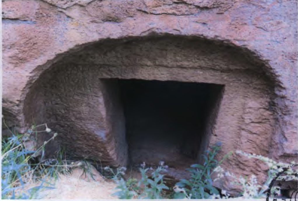
1 Nolu Kaya Oyma Mezar Girişi