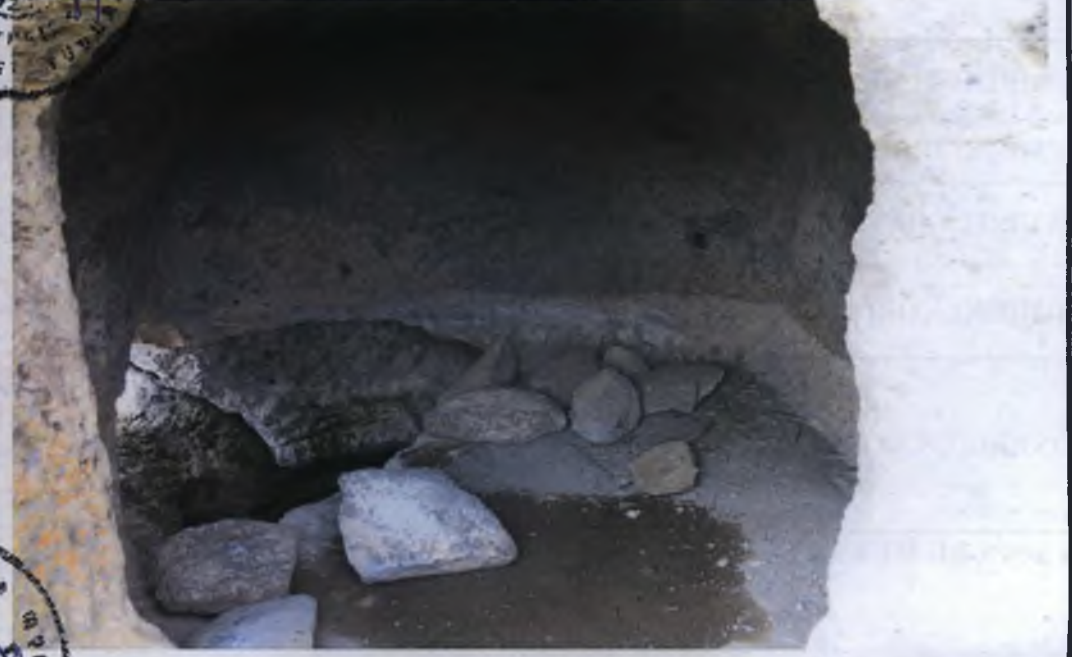
2 Nolu Kaya Oyma Mezar İçi