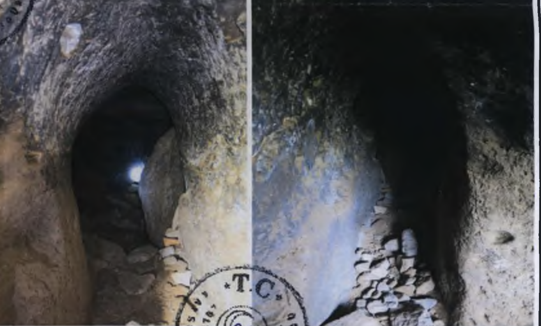
1 Nolu Kaya Oyma Mekan Koridoru