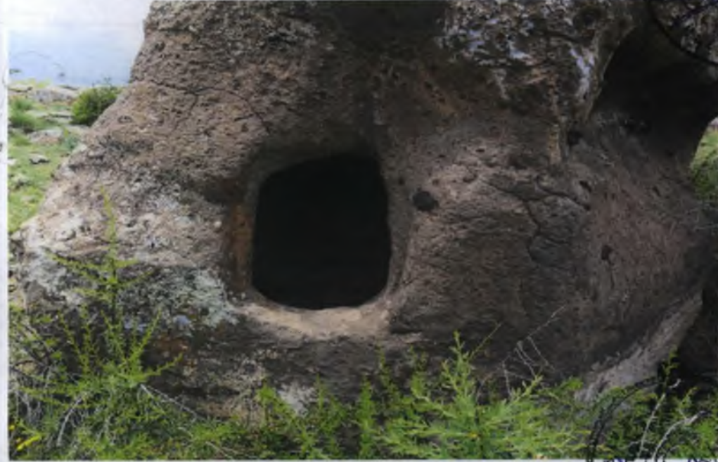
2 Nolu Kaya Oyma Mezar Girişi