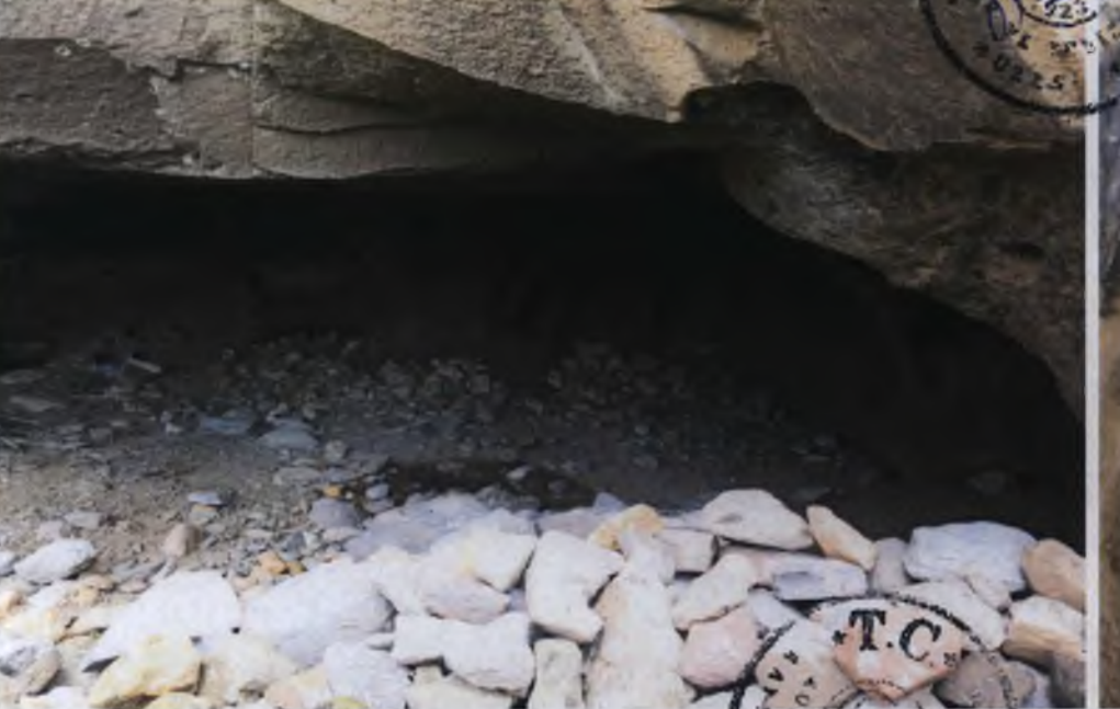
1 Nolu Kaya Oyma Mekan