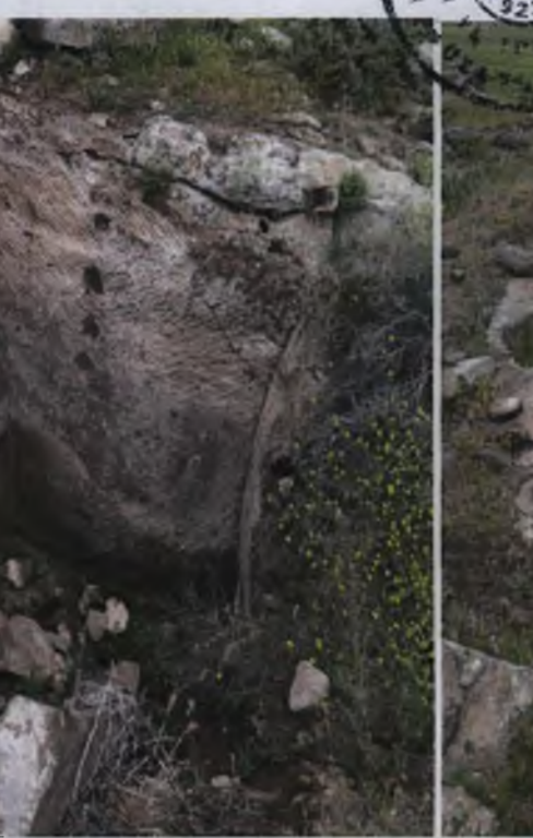
2 Nolu Kaya Oyma Mekan