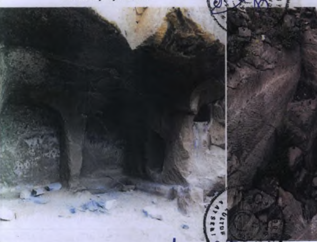
2 Nolu Kaya Oyma Mekan