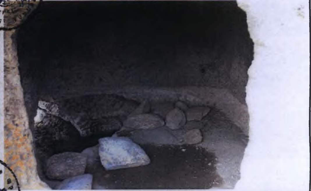
2 Nolu Kaya Oyma Mezar İçi