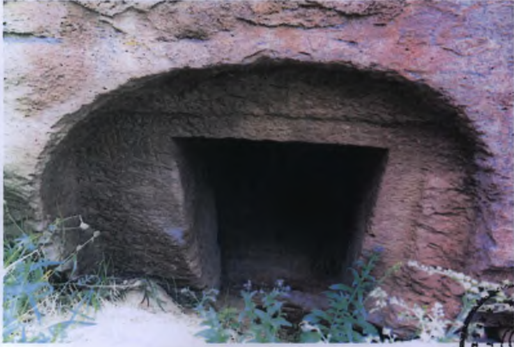
1 Nolu Kaya Oyma Mezar Girişi