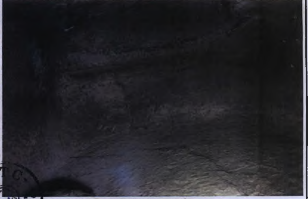
1 Nolu Kaya Oyma Mezar İçi