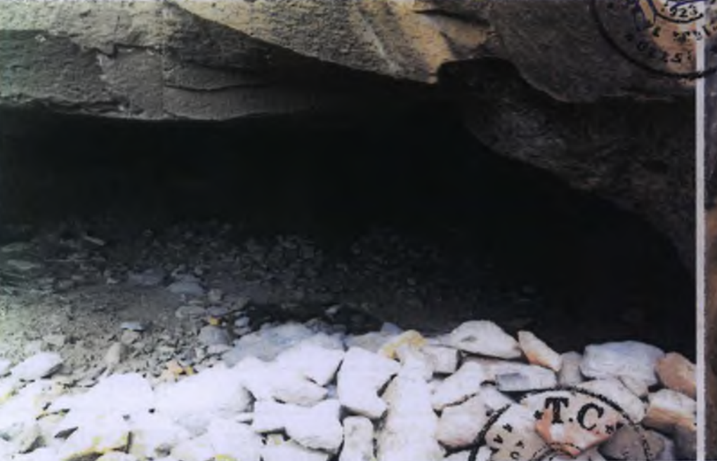
1 Nolu Kaya Oyma Mekan