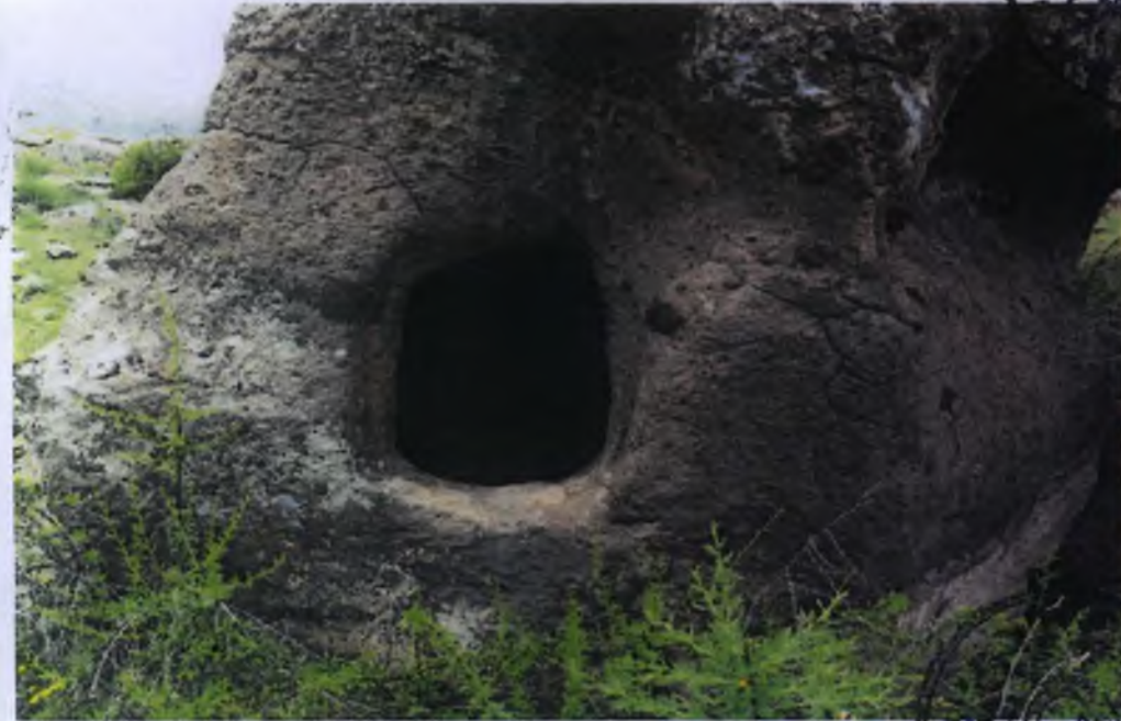
2 Nolu Kaya Oyma Mezar Girişi