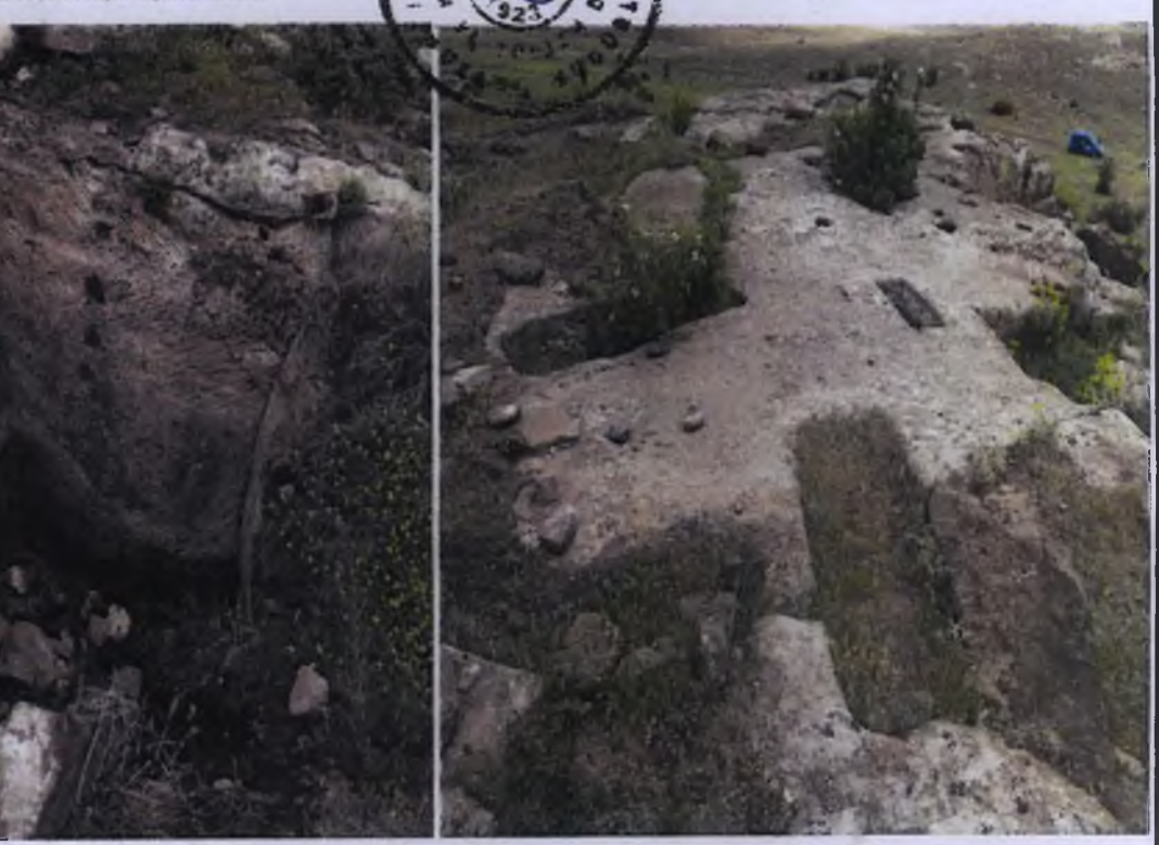
Basit Kaya Oyma Mezarlar