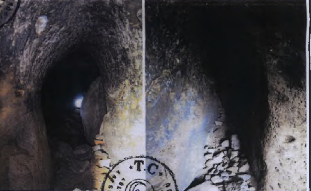
1 Nolu Kaya Oyma Mekan Koridoru