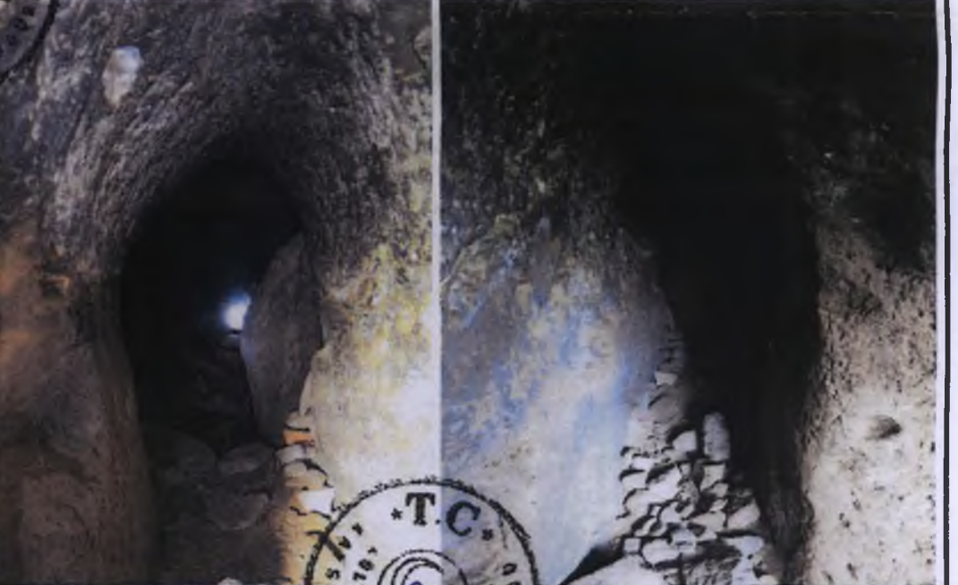
1 Nolu Kaya Oyma Mekan Koridoru