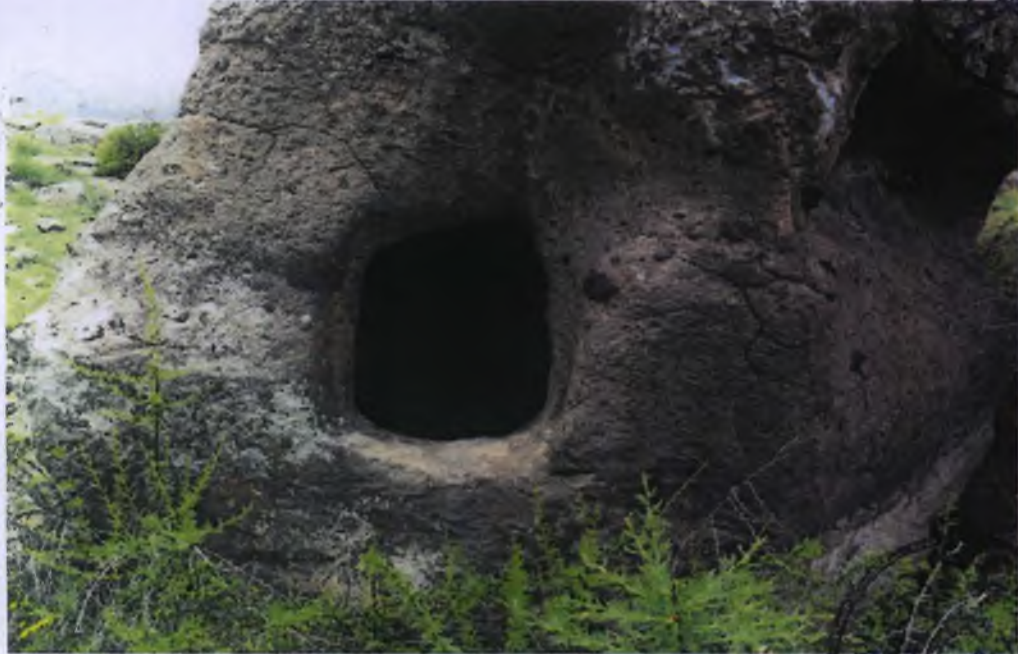
2 Nolu Kaya Oyma Mezar Girişi