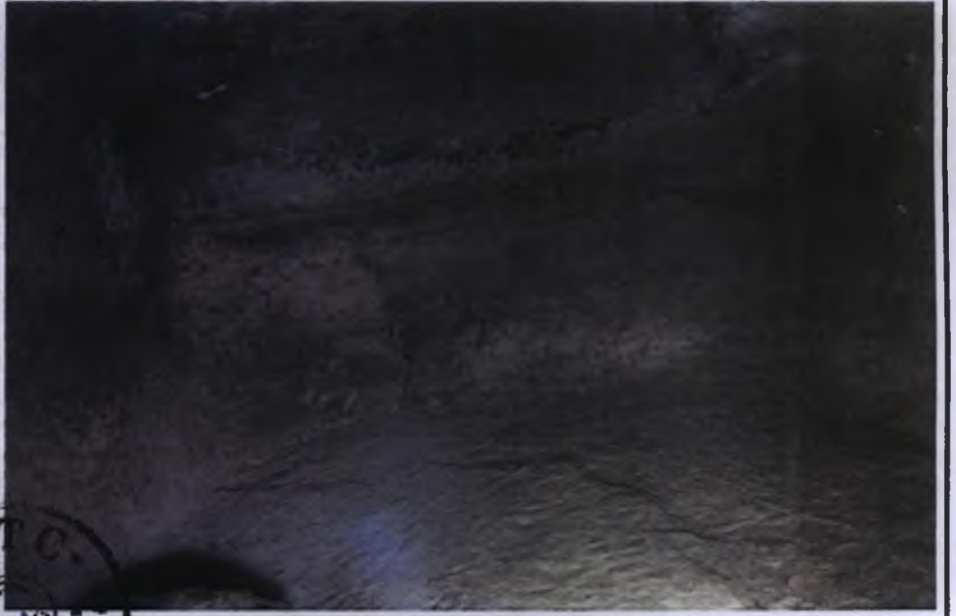
1 Nolu Kaya Oyma Mezar İçi