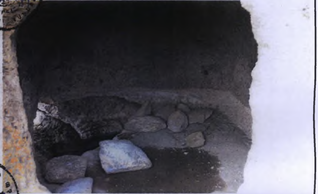
2 Nolu Kaya Oyma Mezar İçi