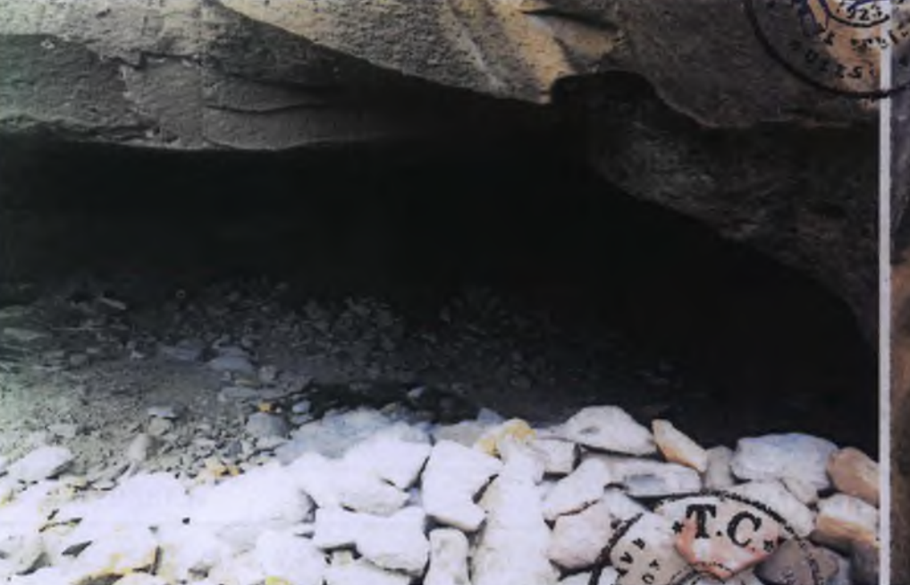
1 Nolu Kaya Oyma Mekan