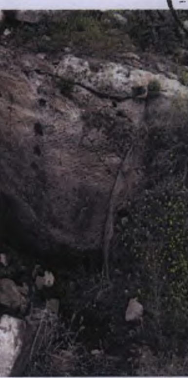
2 Nolu Kaya Oyma Mekan