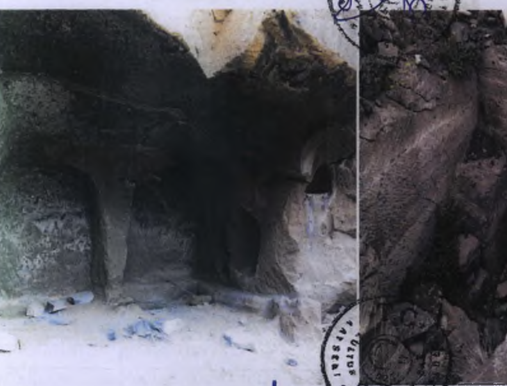
2 Nolu Kaya Oyma Mekan