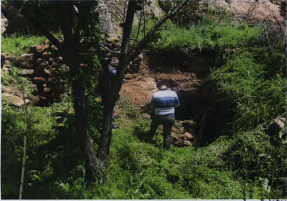
KAYA OYMA MEKAN GIRIŞİ (DİSTAN)