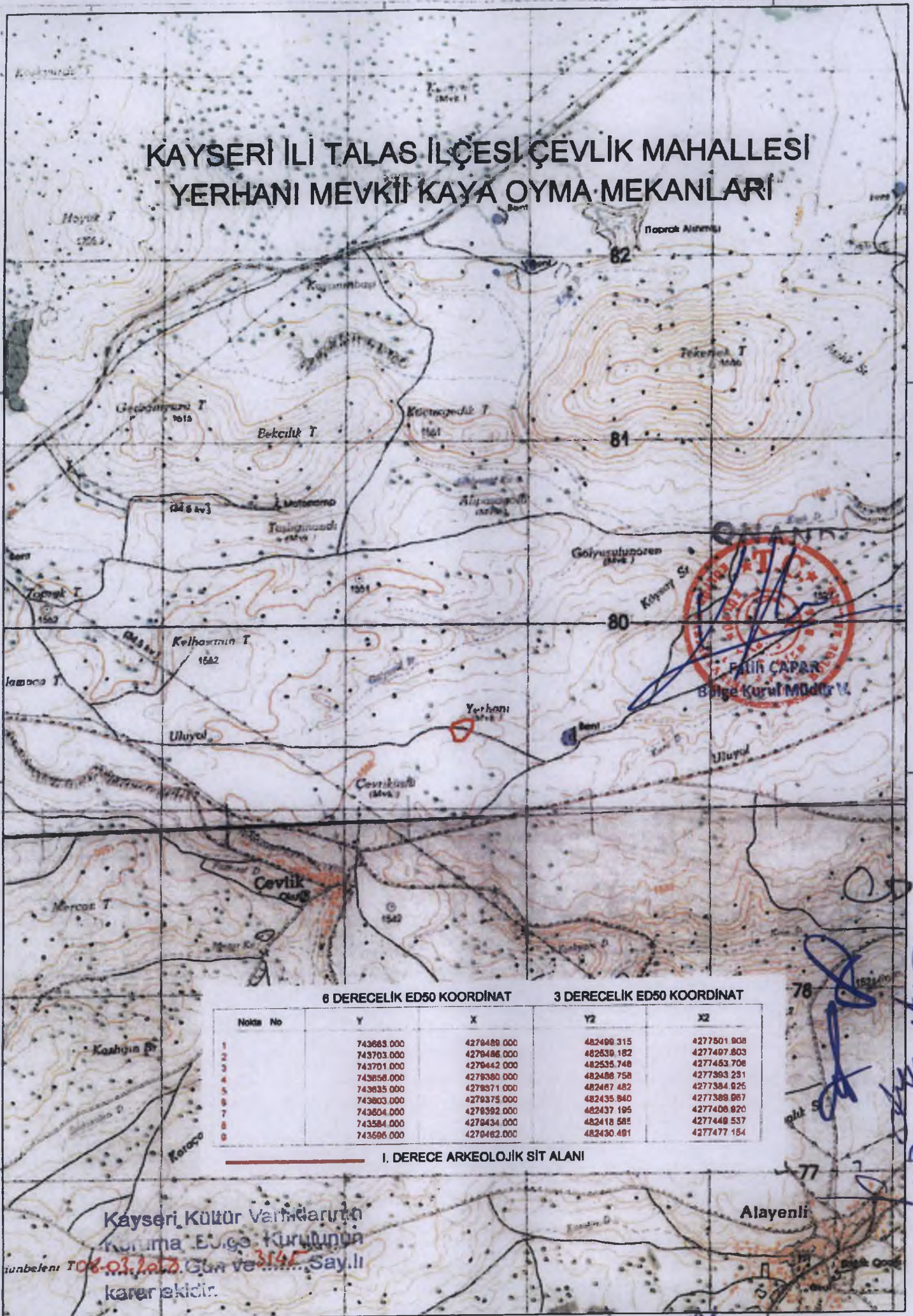
6 DERECELİK ED50 KOORDINAT