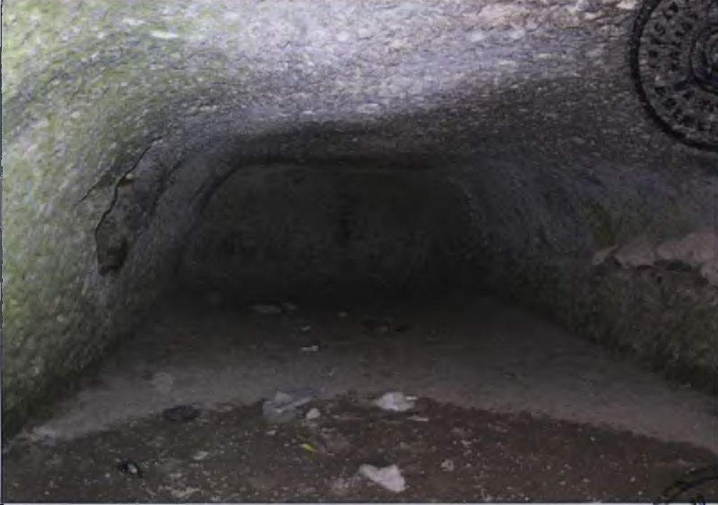
DİKDÖRTGEN PLANLI TEMEL İZLERİ