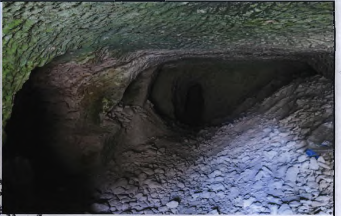
İKİNCİ MEKAN GİRİŞİ