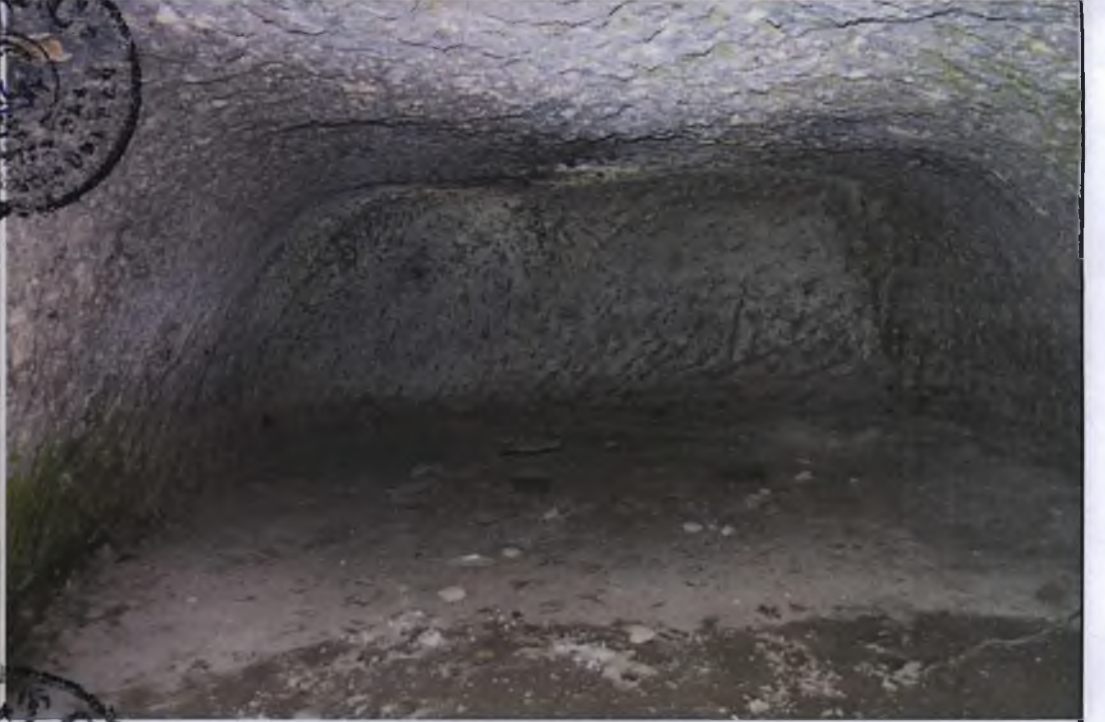
ÜÇÜNCÜ MEKAN GİRİŞİ