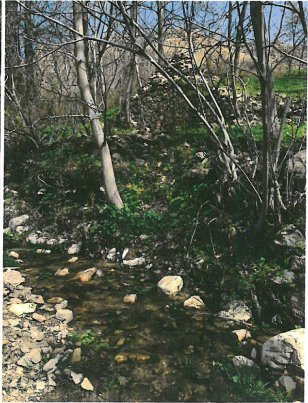
Foto 1-2- 3 Diyarbakır İli, Lice İlçesi, Körtük mahallesi, 329 ada 2 No.lu Parsel III. Nolu Değirmen (Aşe Paşo) 22.03.20183