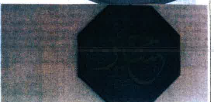
BÖLGE KURULU MÜDÜRLÜĞÜ KÜLTÜR VARLIKLARINI KORUMA TARİH VE SAYILI KAYIT EKİDİR