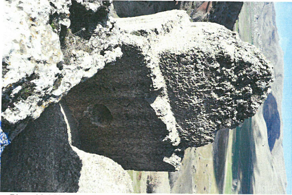
Piramidal Yapının Hemen Doğu Yönünde Bulunan Kaya Mezarı