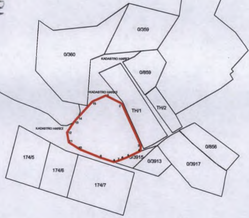
ÖNERİ SİT ALANI KOORDİNATLARI 3 DERECELİK ITRF KOORDİNAT

Kayseri Kültür Varlıklarının Koruma Eöige Kurulunun 01.10.2018 Gün ve 31.95. Sayılı karar ekidir.