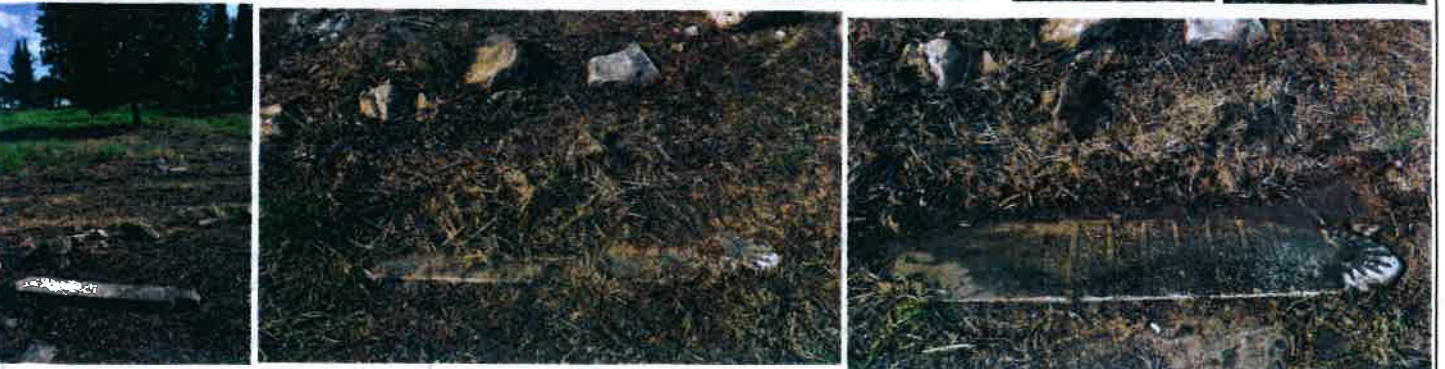
TARİH VE SAYILKARAR EKİDİR.