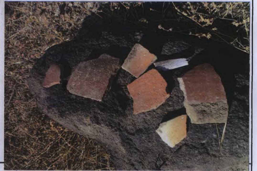
I. DERECE ARKEOLOJİK SİT ALANI (ÖNERİ)