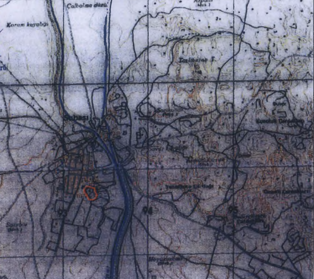
6 DERECELİK ED50 KOORDİNAT 3 DERECELİK ED50 KOORDİNAT