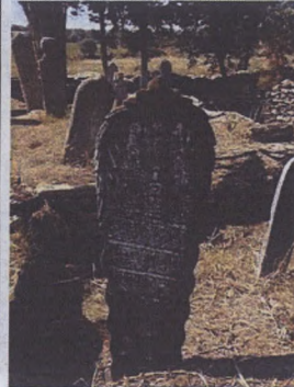
Sene hicri 1292 (miladi 1875-1876)