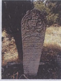
Hotoz Başlıklı kadın mezar taşı El merhume 1941 Teşrini Evvel 1257 La ilahe illallah Muhammeden Resullallah El Merhume Enver zevcesi Esmeyye Ruhuna Fatiha