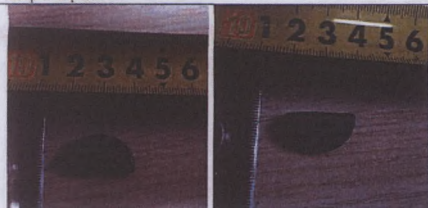
Vatandaş tarafından Manisa Müzesine teslim edilen sikke