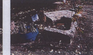
Büyükbölümü kırık ve noksan ostotek?