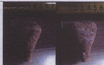
Vatandaş tarafından Manisa Müzesine teslim edilen idol? parçası