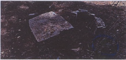
Alandaki işlenmiş blok taşlardan bir örnek