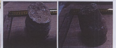
Vatandaş tarafından Manisa Müzesine teslim edilen obje