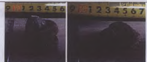
Vatandaş tarafından Manisa Müzesine teslim edilen obje