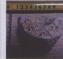
Vatandaş tarafından Manisa Müzesine teslim edilen dip parçası