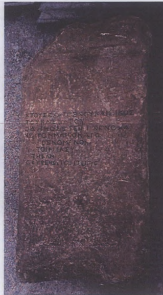
Alandan Manisa Müzesine taşınan büyük stel