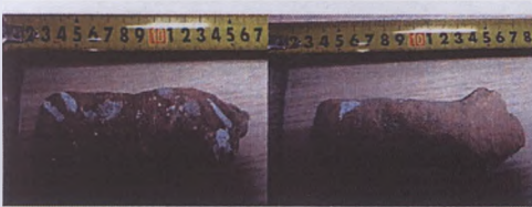
Vatandaş tarafından Manisa Müzesine teslim edilen kulp Parçası