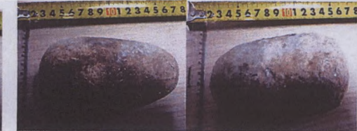
Vatandaş tarafından Manisa Müzesine teslim edilen obje