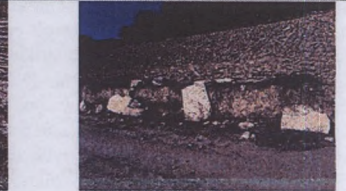
Mezar kapağı olabilecek bloklar