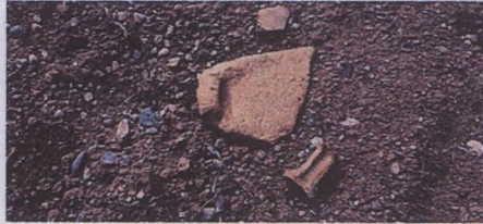
Alandaki pt stroter ve kulp parçaları