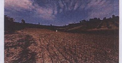
Alandaki kesme blok taşlardan bir örnek genel görünüm