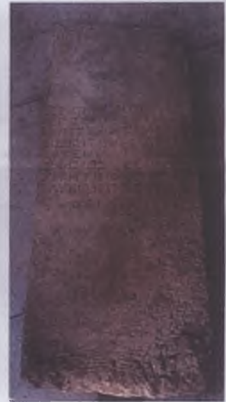
Alandan Manisa Müzesine taşınan küçük stel (sol üstte ayna-farfüm şişesi betimi)