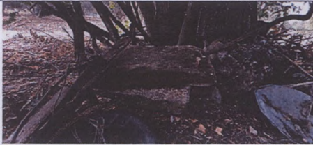
Lahit kapağı olabilecek bloklar