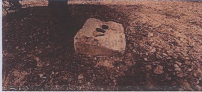
Alandaki kesme blok taşlardan bir örnek