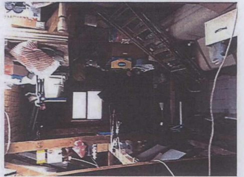
2 kat - krevasi Yapı zemini kat