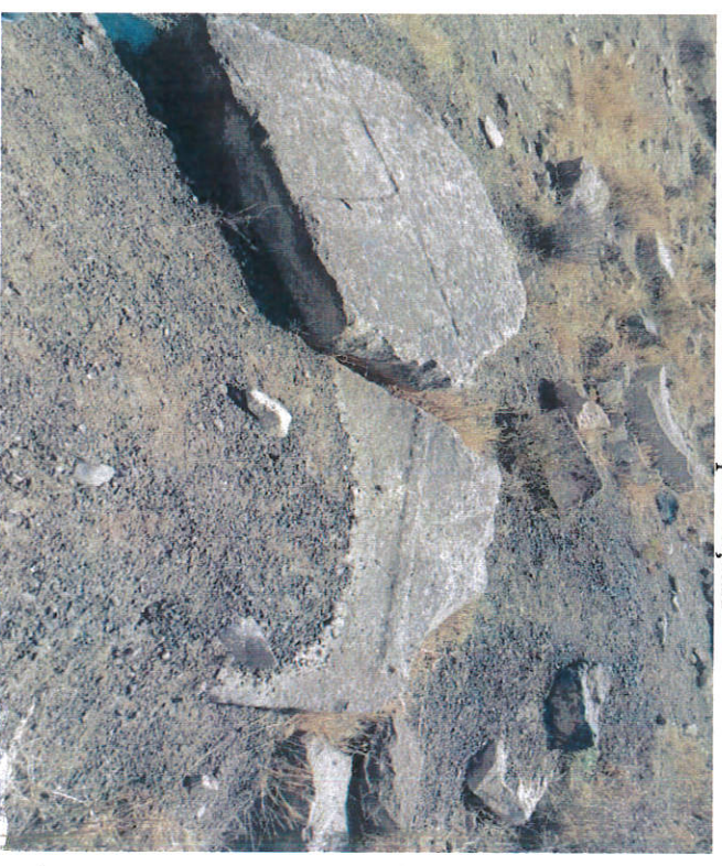
Mezarlar ve kapak taşları