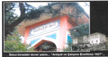
İkinci binadaki duvar yazısı... "Arziyat ve Çalışma Enstitüsü 1927"...