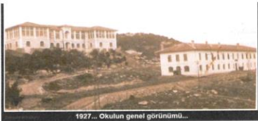
1927... Okulun genel görünümü...