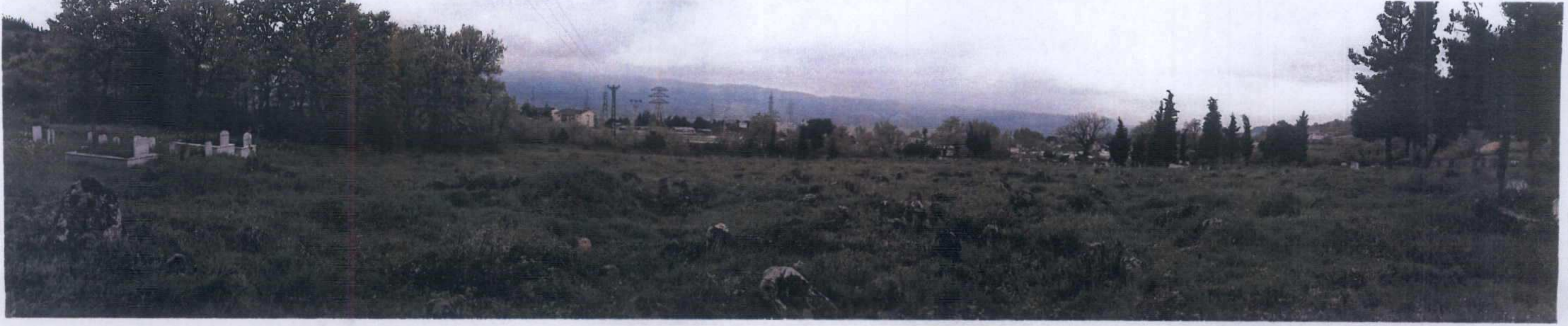
ÇANAKKALE İLİ, ÇAN İLÇESİ, BÜYÜKTEPE KÖYÜ, 1. DERECE ARKEOLOJİK SİT ALANI (NEKROPOL ALANI) SİT HARİTASI