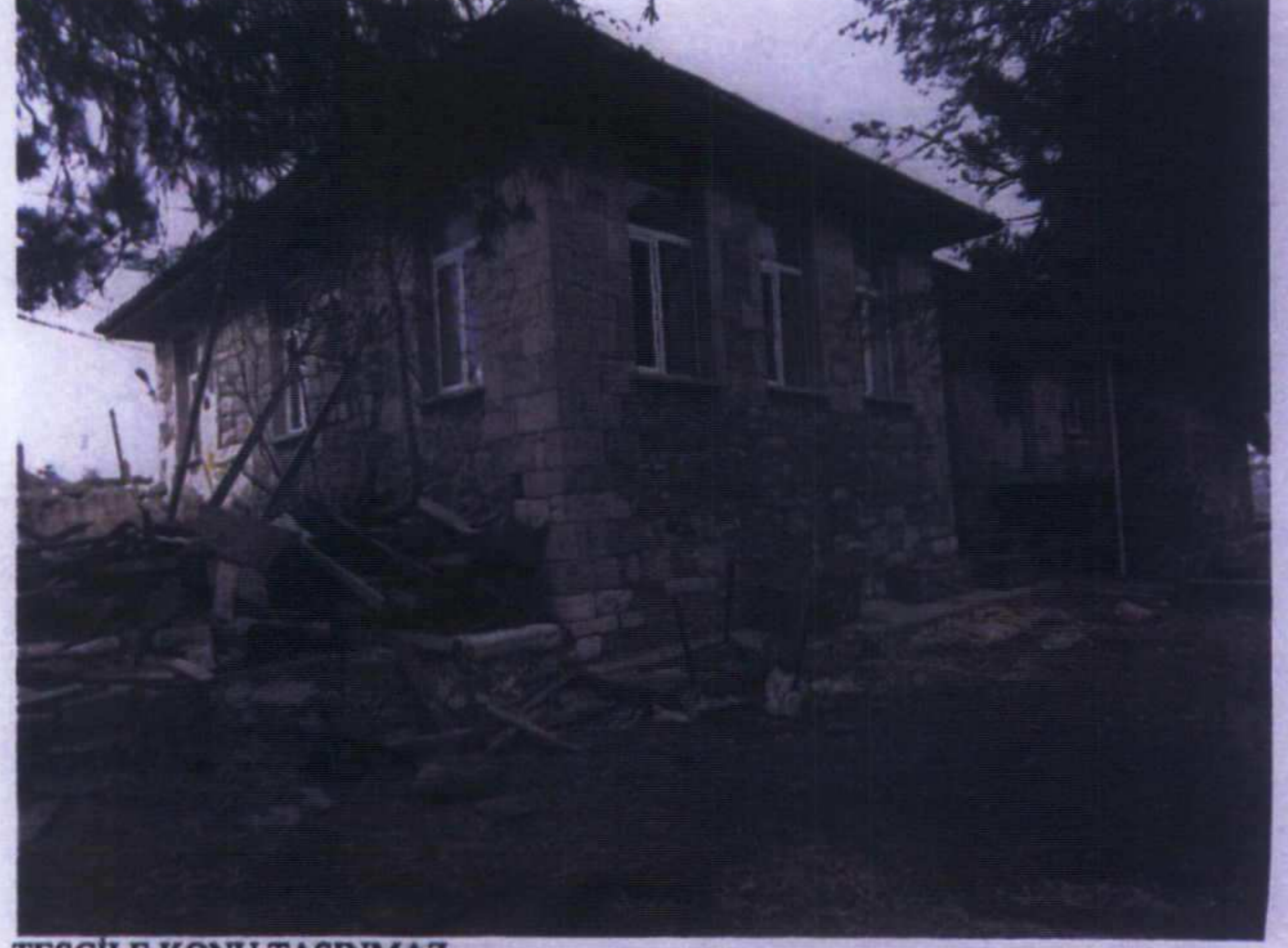
TESCİLE KONU TAŞINMAZ

GÖZLEMLER: Okul binasının inşaat malzemesi taş, örgü sistemi kâğır olup, "U" plan şeması ile Erken Dönem Cumhuriyet okul yapılarının taşrada görülen önemli bir örneğini teşkil etmektedir.