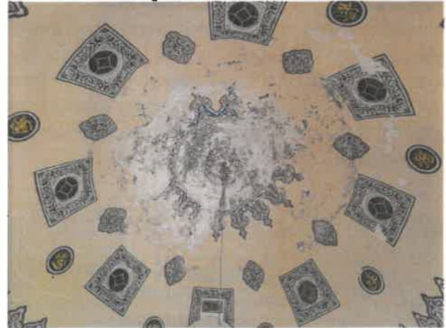
Kubbe İç Mekan Görünümü