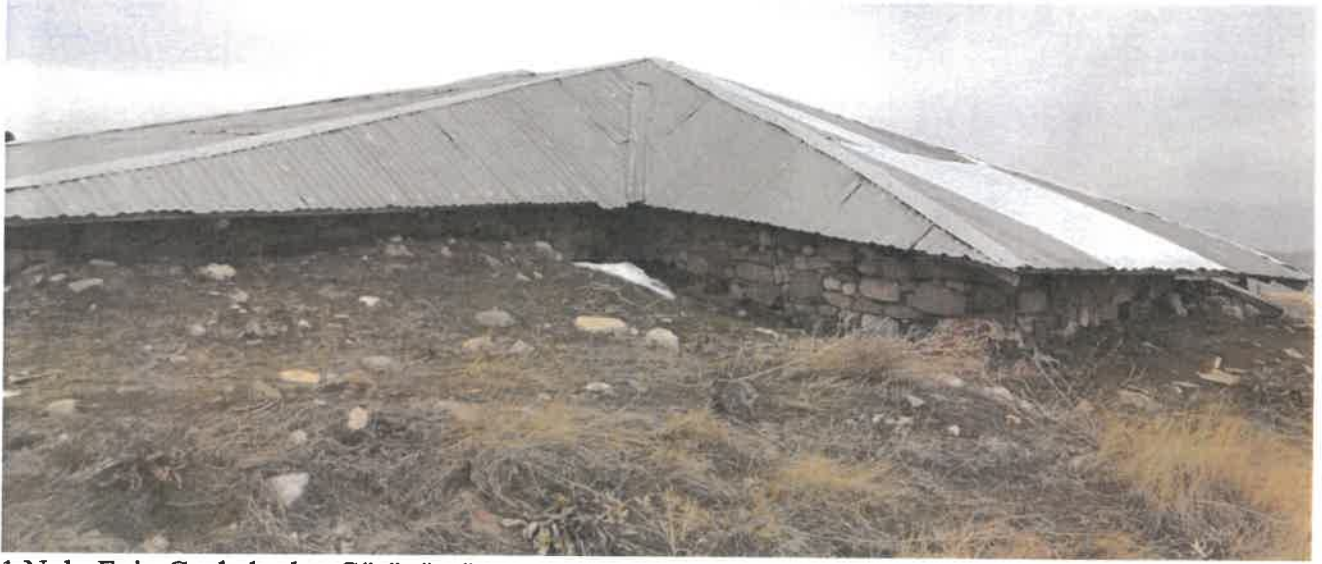
1 Nolu Evin Cephelerden Görünümü