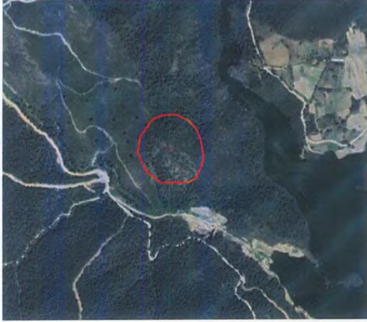
HARİTA- FOTOĞRAFLAR :