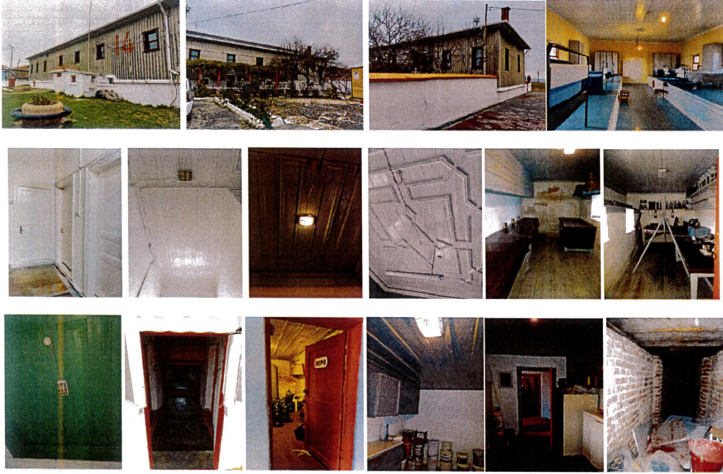
TAHLİSİYE İSTASYONU ROKETHANE-TUVALET VE GARAJ YAPILARI