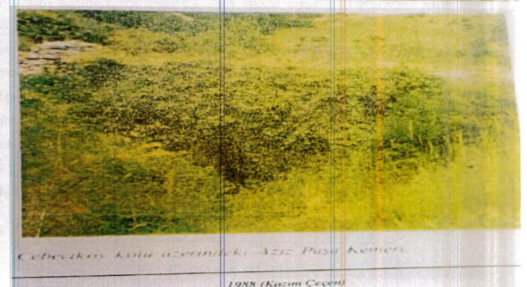
Cebecikoy kolu üzerindeki Aziz Pasa Kemeri 1988 (Kazım Çeçen)