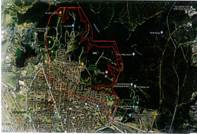
VAZİYET PLANI :