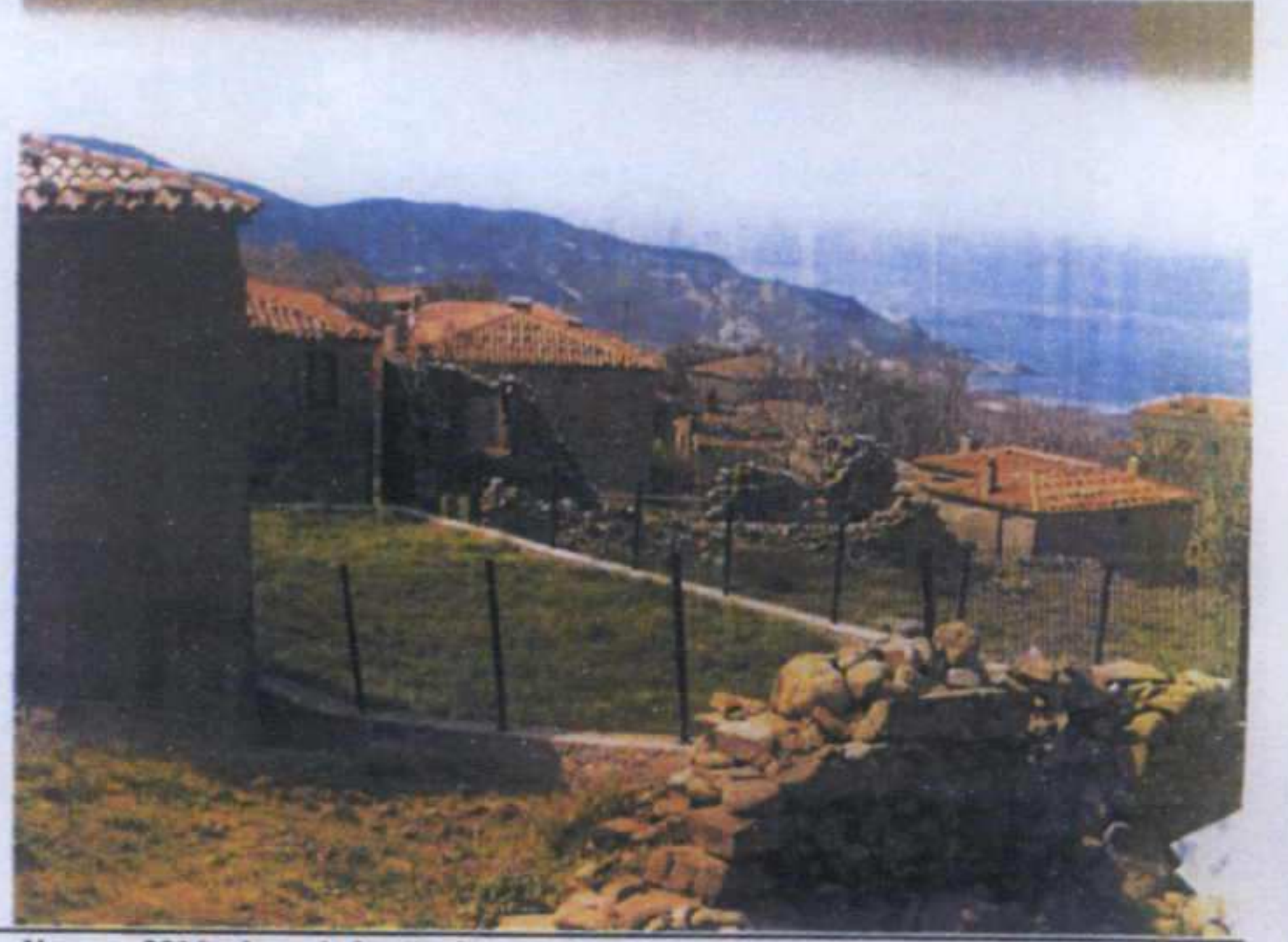
Yapının 2016 yılına ait fotoğraf

GÖZLEMLER: Parsel üzerindeki yapı yıkılmış durumdadır.