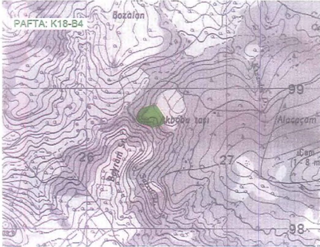
HARİTA- FOTOĞRAFLAR :