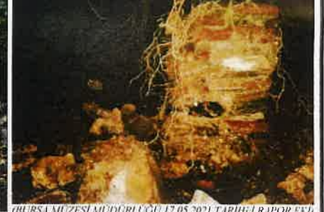
(BURSA MÜZESİ MÜDÜRLÜĞÜ 17.05.2021 TARİHLİ RAPOR EKİ)