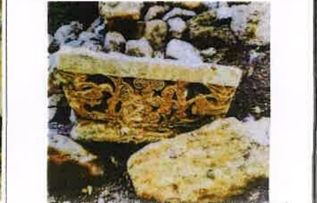
(BURSA MÜZESİ MÜDÜRLÜĞÜ 17.05.2021 TARİHLİ RAPOR EKİ)